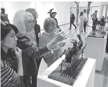
11月／フランス・バルビゾン村から村長一 行が来市。施設見学、芸術文化体験 や市民交流などを行った。