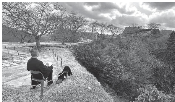
竹田城跡でのスケッチの様子