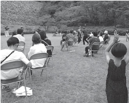
9月／朝来市で初の開催となった 豊岡演劇祭