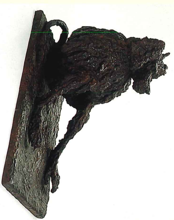
聖マントヒヒ(1966年) Sacred Baboon