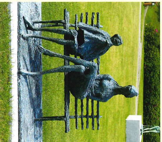
ローマの公園(1976年) Park in Rome