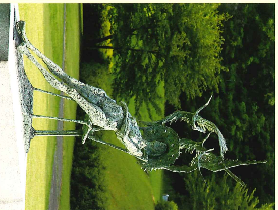
朝来、サナカの思い出(2004年) Remembrances of Sanaka in Asago