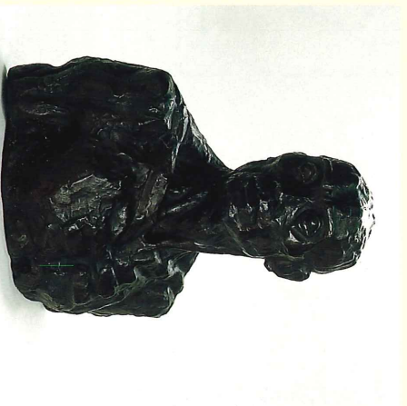
男の胸像(1929年) Bust of a Man

彫刻家淀井敏夫の作品を中心に朝来市主催の各種公募展の受賞作品のほか広く美術資料などを系統的に収集しています。